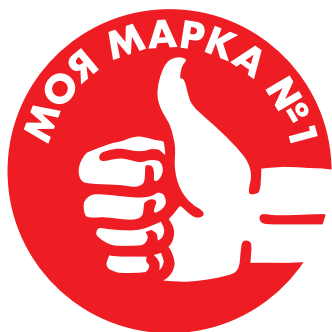
МОЯ МАРКА №1